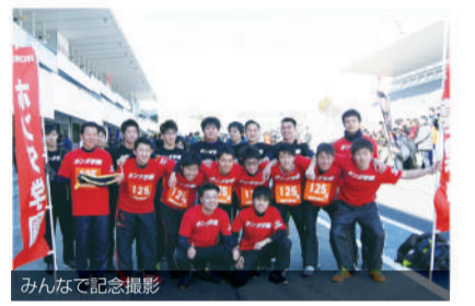
みんなでの記念撮影

学生達は、F1レースが行われる鈴鹿サーキットを自分の足で走るという貴重な体験が出来、是非また参加したいと、すぐに練習を始めた学生もいました。来年はさらに上位を目指したいと思います。