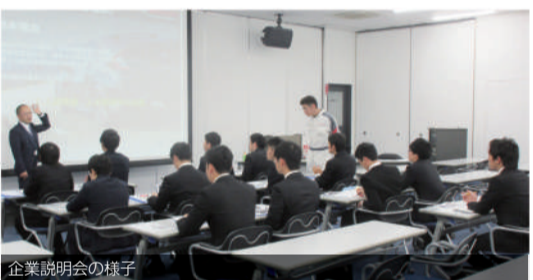
企業説明会の様子