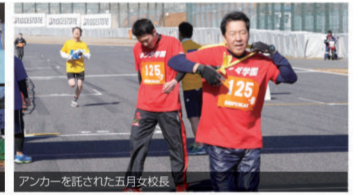
アンカーを託された五月女校長