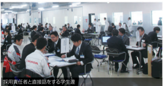
採用責任者と直接話をする学生達

就職活動は「会社説明会」等の本格的な活動がスタートし、自分の夢の実現に向けてチャレンジが始まっています。