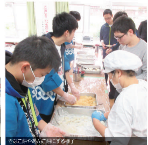
きなこ餅やあんこ餅にする様子