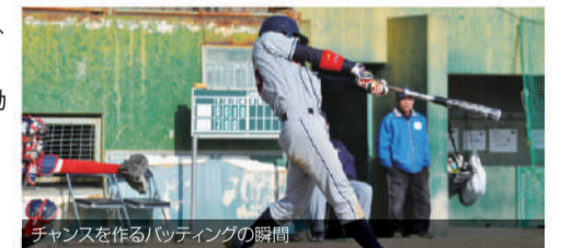
チャンスを作るバットの瞬間