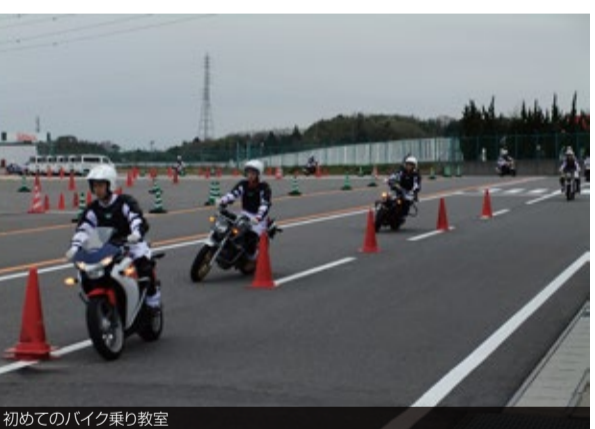
初めてのバイク乗り教室

各科新入生は4月9日(木)、14日(火)の前後半2グループに分かれて、三重県鈴鹿市のホンダ交通教育センターでの「モビリティ体験」を実施しました。このモビリティ体験は、入学後自動車整備や研究開発を学ぶ上で、実車走行を体験し、よりクルマに興味を持ち、勉強への意欲を向上させる事を目的に実施しています。 参加した新入生には免許を持っていても、実車走行は初めての学生もいて、最初は緊張しながらも積極的にトライする姿勢が出てきていました。また、安全に関する座学も実施され、交通社会人としての交通マナーや安全運転に対する重要性を勉強していました。 併せて、ホンダ鈴鹿工場での自動車組立ラインの見学も行われ、高品質の自動車が組み立てられて行く工程を見る事で、更に整備の重要性や良いクルマ作りへの意識が強くなった様子でした。 新入生の感想「バイクに乗って走った爽快感は忘れられません。これからは、お客様にこの爽快感を楽しんで、そして安心して乗ってもらえるようにクルマの整備をしっかり勉強していこうと思いました。今日は本当に楽しい1日でした」