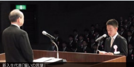
新入生代表「誓いの言葉」