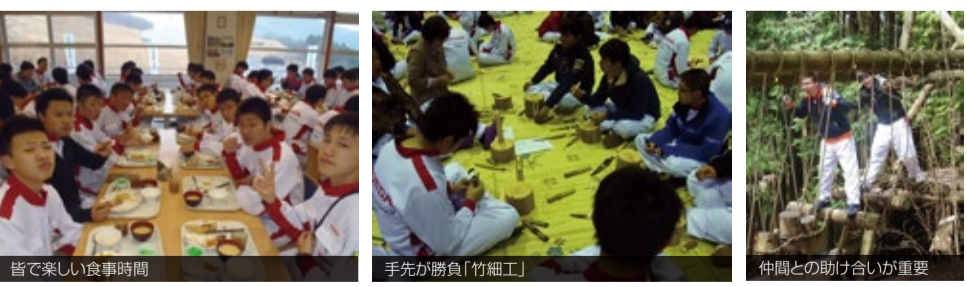
皆で楽しい食事時間