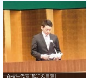
在校生代表「歓迎の言葉」