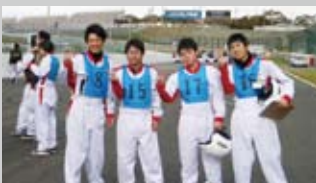
高速運転講習を終え笑顔の学生