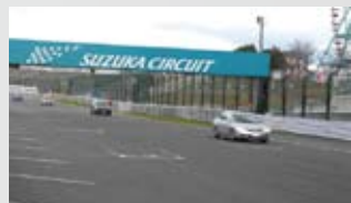
鈴鹿サーキットを走行するのは貴重な体験

12月上旬、2グループに分かれ、自動車整備科、一級自動車整備研究科の1年生を対象に三重県鈴鹿市「鈴鹿サーキット交通教育センター」で安全運転講習を実施しました。この講習は、安全運転の指導が出来るホンダ認定資格「ホンダ・セーフティコーディネーター」の取得を通じ安全運転を身に付けることを目的に実施しています。交通教育センターのインストラクター指導の下、実技や学科試験を通して二輪・四輪の安全運転に対する技術と知識を養います。また、国際レースが行われるレーシングコースで高速運転講習を行い100Km/h以上のスピードを体験出来る事もこの講習の大きな魅力です。講習を終えた学生からは「安全運転に対する意識や心構えが身に付いた」「レーシングコースを自分で運転できたことは一生の思い出」などの意見が聞かれました。今回の安全運転講習を通して安全運転に対する知識や技術の習得だけでなく、自動車業界を支える一員として「プロの意識」も更に磨かれました。