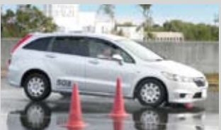
濡れた路面での車の制御方法を体験