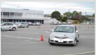
運転技術を学ぶバイロスラローム