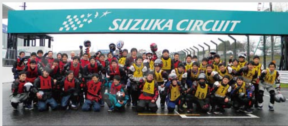
鈴鹿サーキットのコース内にて