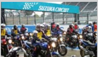
鈴鹿サーキットをバイクで走行