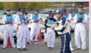
インストラクター指導のもと実技を学ぶ