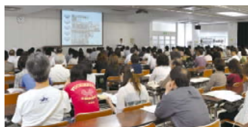
授業見学の前に学校の近況や就職の安定性を説明

事故の実態や安全に対する心構えなどをお話していただき、学生たちの安全運転に対する意識が高まったと思います。