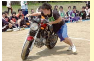
障害物競走はバイクを押ししたり、整備の道具を持って走ったりと、自動車学校らしい楽しい内容