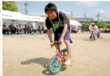
バイク好きなら小さくたって乗りこなすのはおてのもの?!ミニ自転車レース