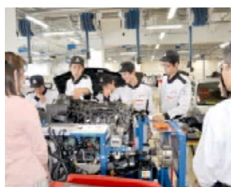
少し照れながら保護者の方に授業内容を説明

当日は、各グループに分かれて授業を見学。学生たちの活き活きと授業に取り組む姿を見て安心されたようでした。