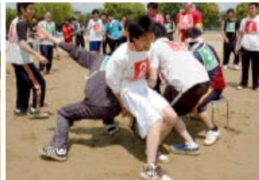
今年から新しく加わったイス取りゲーム