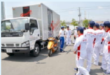
実車を使用して死角の確認、意外と見えないところが多い

本校では自動車業界の一員になる学生たちに、安全運転に対する知識と技術をしっかり身に付けてもらい、事故を未然に防ぐために1年次だけでなく2年次も安全運転について学びます。