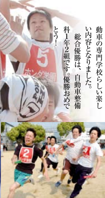
優勝をかけて真剣勝負 クラス対抗スウェーデンリレー

今後私は学園祭に向けて委員会のみんなと協力し合い、体育祭に負けないくらい楽しい学園祭にしていきたいと考えています！