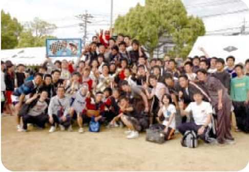
優勝した自動車整備科1年2組のみんな(写真下)