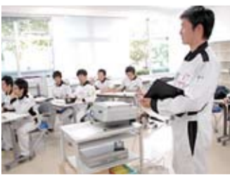
インターンシップで得た経験を共有する報告会

このインターンシップはバイクに興味と情熱を持った学生たちに就業体験を通して、普段は決して見ることのできない開発の現場を肌で感じてもらう、将来の方向性や「動く」ということを実感してもらうことが目的です。インターンシップを終えた学生たちからは「研究所の方々には自分の仕事に自信と誇りを持ち、純粋に楽しみながら働いていたのが印象的でした」といった感想が聞かれ、「動く」ということが今まで以上に実感できたようでした。