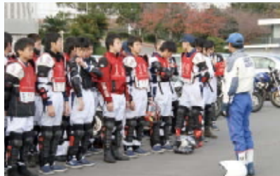
インストラクターの指導のもと実技を学ぶ