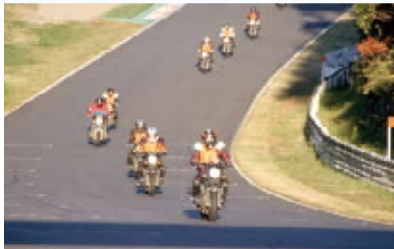
鈴鹿サーキットを走行するのは貴重な経験