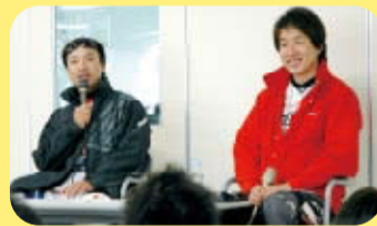
トライアルを通して安全運転の大切さを語る講話