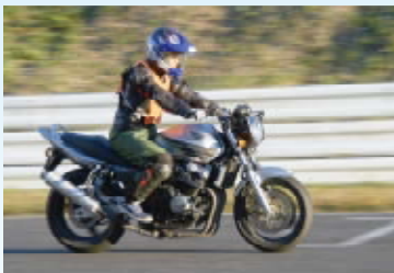
鈴鹿サーキットをバイクで走行

安全運転講習を通して安全運転に対する知識や技術の習得だけでなく、自動車業界を支える一員として「プロの意識」も磨かれました。