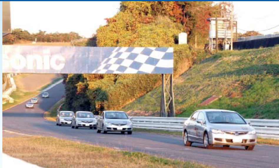
鈴鹿サーキットレーシングコースを利用して安全運転の技術を学ぶ