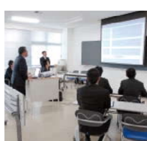
企業セミナーには60社以上の企業が集る

この企業セミナーは、ディーラー、開発・製造系企業など全国から60社以上の企業の方々が集まり、学生たちに会社説明や「求める人物像」などを説明していただく一大イベントで、