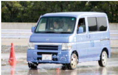
濡れた路面での車の制御方法を体験