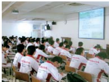
メモを取るなど熱心に講話を聴く

講話に参加した学生たちは、ミニバン売り上げNo.1のフリードに使用される最新技術が聞けるとあって、熱心に講話を聴いていました。また、フリードの開発秘話を通して自動車開発に対する熱い思いも学んでいました。