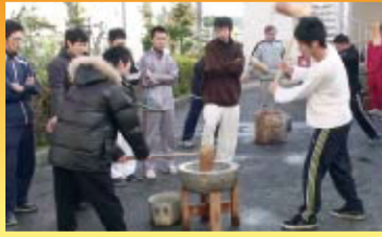
ねばりが出るまで皆で順番に餅をついていきます

また、当日本校で開催していた体験授業の参加者のみなさんにもお餅を振舞い、つき立ての餅のおいしさも体験していただきました。