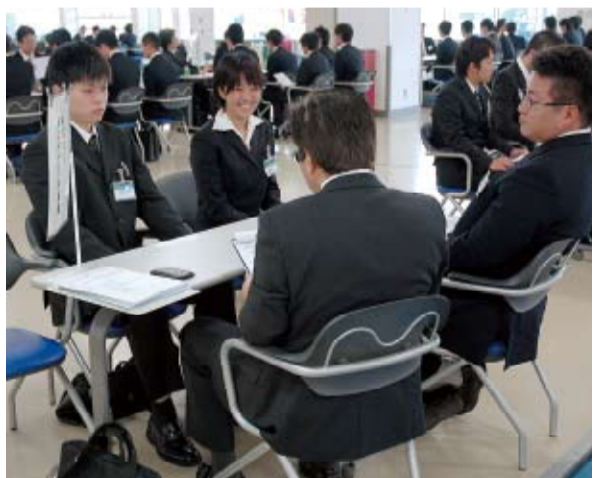
就職を希望する企業のブースで熱心に話を聴いたり、質問をぶつける

学生たちは、希望する企業のブースで熱心に話を聴いたり、質問をぶつけたりしながら企業研究に励みました。厳しい就職戦線ですが、勝ち抜くために頑張りたい!