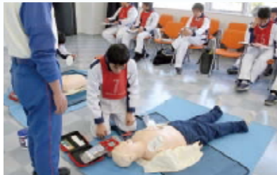
事故に遭遇した際の人命救助の方法を学ぶ