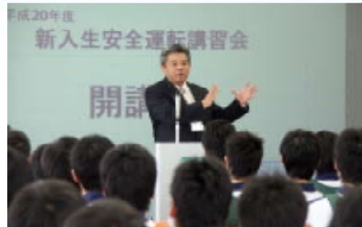
開校式で教育センター所長から訓示をいただく