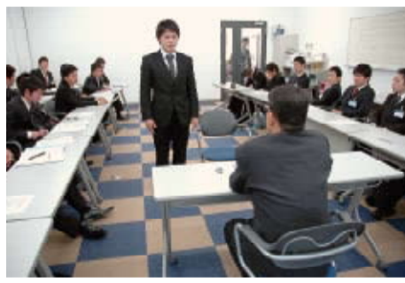
繰り返し練習することで面接の基礎を身に付けていく

参加した学生たちは、講師からのアドバイスや学生同士の相互評価を元に、自身の改善点の確認や面接のスキルアップを図りました。