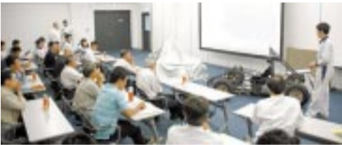
恩師が見守る前でモックアップのプレゼンテーション

6月15日(金)、自動車研究開発科は「スキルアップ確認会」を開催しました。これは、昨年新設された自動車研究開発科の2年生(1期生)の学生達が、モックアップ製作までのプレゼンテーションを通して、この1年間での成長だけ成長したのかを母校の先生方に見て頂き、自信をつけてもらう事を目的としています。参加された高校の先生方からは「今後のF・S・A E大会に向けての活動が、益々楽しみです」と励ましのお言葉を頂きました。