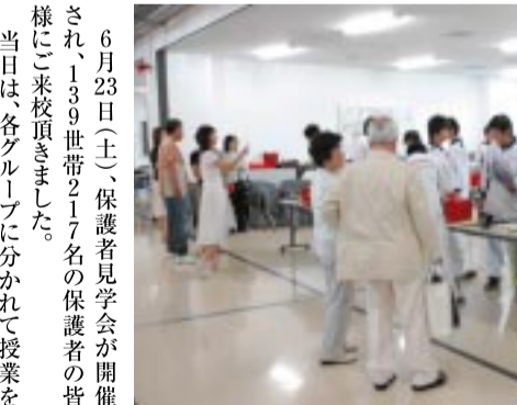
授業を見守る保護者の方々

6月23日(土)、保護者見学会が開催され、139世帯217名の保護者の皆様にご来校頂きました。当日は、各グループに分かれて授業を見学。ご子弟が真剣に授業に取り組む姿を見て、大変安心されている様子でした。ご参加頂いた保護者の皆様、ありがとうございました。