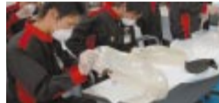
カットや研磨で形を整えていきます