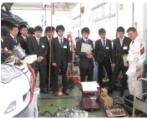
販売会社のピット内を見学

6月8日(金)、一年生を対象にHonda販売会社訪問が実施されました。この訪問の目的は、販売会社の業務、サービス活動などを見学するとともに、第一線で活躍されている社員の方々からお話を聞くことで、より積極的に学生に勉強に取り組んでもらう事です。