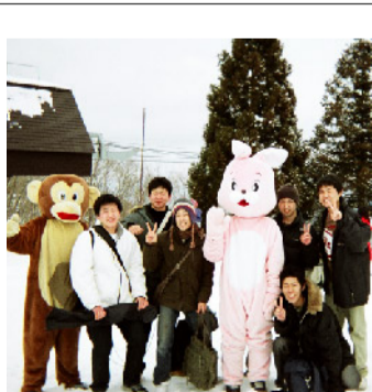
文化系 写真同好会

今年は、去年よりも部員が増え、皆で楽しく明るい活気のある同好会活動を展開しています。軽音楽同好会のお披露目の場といえば、やっぱり学園祭。今年もガンガンに盛り上げていきたいと思ひます。また、部員数が増えた事もあり、今までとは違った形の活動もできるのでは、と新たなアイデアを模索しています。