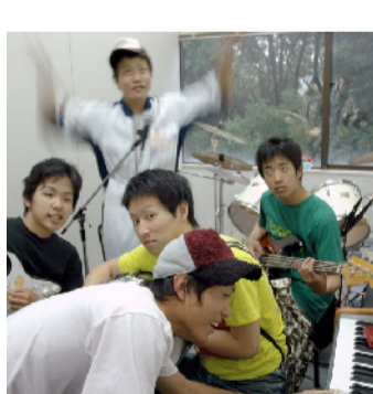
文化系 軽音楽同好会

サッカー人気は熱も手伝って、毎年入部希望者が後を絶ちません。しかし、チームだからといっていい加減に加入してくるメンバーはあらず、先生も含めて皆サッカーが大好きです。試合前の練習では、先生も一緒にやっています。試合前の練習では、先生も一緒にやっています。試合前の練習では、先生も一緒にやっています。