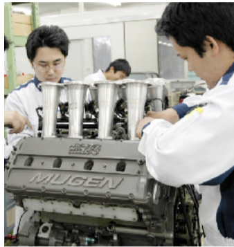
技術系 四輪整備同好会

二輪整備同好会は、鈴鹿8耐や鈴鹿300kmなど、大きなレースのメカニックとして参戦する「ツーリング」や、学校や同好会所有のバイクを整備する「二輪整備」の2つに分かれています。だから、自分のバイクを修理したい人からレース活動に参加したい人まで、他では絶対味わえない経験と感動を体験できます！