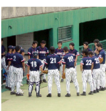
スポーツ系 野球同好会

ゴルフ同好会の活動は、月1回の試打場での練習と年1～2回のショートコースのラウンドです。本年度は、2年生だけで活動がスタートしました。少ない練習でもゴルフの楽しさを知り、コースを回れるレベルまで技術を上げて、みんなですラウンドします。卒業後もいろんな友達とラウンドできると嬉しいですね。