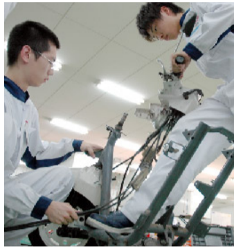
技術系 EVソーラーカー同好会

現在のエコラン同好会は、以前に比べて記録が低迷しています。なぜかというところ、先輩達が成し遂げた「全国大会6連覇」という偉業が大きく立ちふさがっているためです。しかし、壁が大きいほど燃えています。先輩達の偉業に追いいつき、追い越してやるという思いを胸に、10月10日に行われるHonda Eco Power全国大会に挑みます。