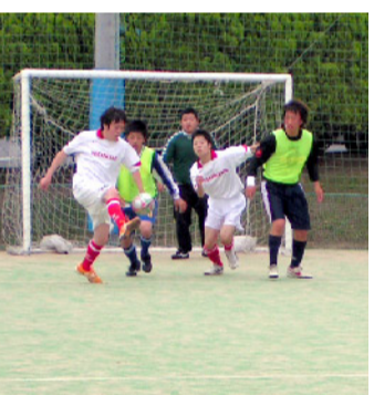
スポーツ系 フットサル同好会

エコチャレンジ同好会は、まだ出来たてのヤホヤの同好会です。現メンバーは昨年1年間しっかりと下準備のもと、今年より早く車両作成までこぎつけました。電気自動車の制作を目指して、毎日頑張っています。また、Eco環境にこだわりたい人は、大阪狭山市で毎月行われる市内清掃へ積極的に参加しています。