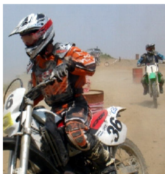
技術系 オフロード同好会

四輪整備同好会は、就職先で即戦力となる人材を目指して「ブレーキ・エンジン・車体の分解」などの整備活動を行っています。また、整備をするだけでなく、実際に自分でカーを走らせてもいます。現在25名の部員がいます。みんな車を触るのが大好きな学生ばかりです。将来の事を考え、技術をより深く学ぶために頑張っています。