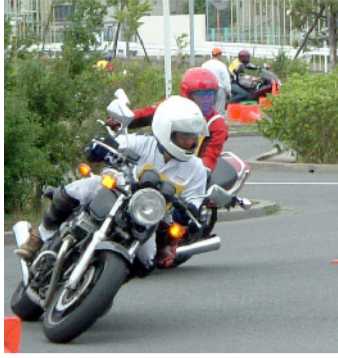
技術系 オートバイ同好会