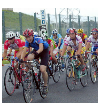
スポーツ系 サイクルスポーツ同好会

ボディビル同好会は、日頃の運動不足を体動かすことで解消しています。マシンも色々揃っているため、基礎体力強化から個々が鍛えたい部位まで、個人のメニューに添って活動しています。筋肉を鍛えるだけでなく、体力向上と維持を目指しています。日頃のストレッチは最高です。「楽しく、そして自分に厳しく！」