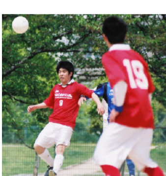
スポーツ系 サッカー同好会

サイクルスポーツ同好会の歴史は古く、20年近く続いています。自転車好きの仲間が集い、サイクリングから各種大会まで幅広く活動しています。大会は、日本国内でも数多くの大会がありますが、年間2～4大会に出場しています。自分の体だけでマシンを操り、風を切って疾走する。これこそ爽快そのものです！