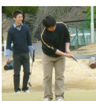
スポーツ系 ゴルフ同好会

ランニング同好会は、自己練習を中心とし、月1～2回程度の合同練習を実施しています。目標は、鈴鹿サーキットです。憧れの鈴鹿サーキットを自分の足で走るのは、またとないチャンス。メンバーそれぞれが自分の限界にチャレンジし、自己ベストタイムを更新できるように頑張っています。