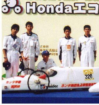
技術系 エコラン同好会

オートバイ同好会は、2輪車の運転技術向上と安全運転を目標として活動に取り組みます。単に乗車時の技術をアップさせるだけではなく、2輪車の「走る・曲がる・止まる」という全ての動作について奥深く追求し、校庭での乗車練習から校外へのツーリング、大会への出場など、常に目標と問題意識を持ち頑張っています。