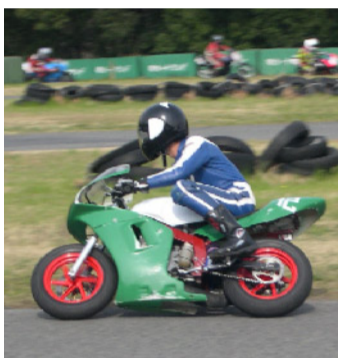
技術系 ミニバイクレース同好会

大自然の中にあるコースでもおもしろい汗を流す！今、海外で大人気で最もエキサイティングなスポーツそれがモトクロスです。アップダウンやジャンプの多い、デコボコ道を走破した時の快感は、何ものにも変え難いものがあります。速く走る事、技術を向上させる事も大切ですが、楽しく走り整備するを第一に活動しています。