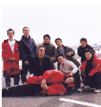
スポーツ系 ランニング同好会

フットサル同好会は、昨年サッカーやフットサルの経験者が集まり発足した、まだまだ新しい同好会です。経験者、未経験者問わず、「フットサルをやってみよう」とにかく楽しむ！をモットーに活動しています。大会での結果ももちろん大切なのですが、やっぱり「やってみよう」というのが一番大切ですね。