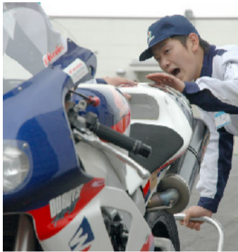
技術系 二輪整備同好会

EVソーラーカー同好会は、電気自動車改造の制作を通して電気自動車の知識習得を目指しています。EVソーラーカー同好会は、まだ設立したばかりなので課題は山積みですが、活動に励み、部員達と協力し、素晴らしい同好会を作り上げていきたいと思ひます。今後の目標は、四国EVラリー出場です。現在大会に向けて車両を制作しています。