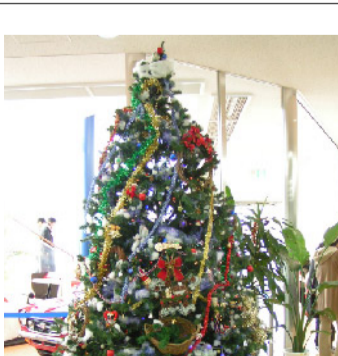
文化系 ガーデニング同好会

写真に詳しい人も、詳しくない人も一緒に楽しく撮影するのが写真同好会。校外での撮影や、学園祭の準備等を通して、カメラや写真に自然に慣れさせていきます。また、季節ごとの風景の変化や名所、遺跡の撮影を通じて、感性や知識の向上を目指します。「楽しくなければ意味がない！」を合言葉にこれからも楽しく活動していきます。