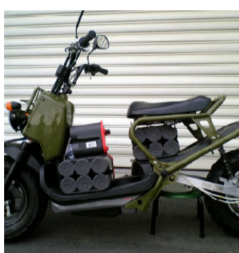
技術系 エコチャレンジ同好会

古い車両を修理するというのは分からない事が多いので、自分で調べて先輩に聞きながら活動しています。今は、壊れた車両(CVCCシビック)の修理をして、エンジン音を聞く事を目標に頑張っています。古い車両を修理するというのは、地味な作業に見えますが、新車同様にキレイにしていく事は気持ちがいいです。