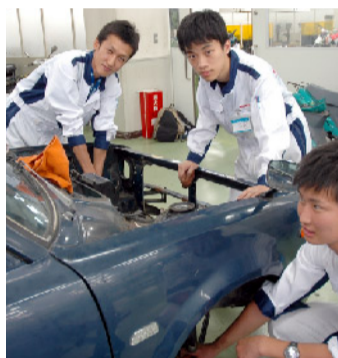
技術系 レストア同好会

ミニバイクレース同好会は、設立2年目の新しい同好会です。活動内容は、堺カートのランドで開催されるミニバイクレースへの出場や、走行会、体力トレーニングなどです。「速く走る」ということだけではなく、「みんな楽しく！」をモットーに、これからも活動を楽しいていきたいと思ひます。ミニバイクを通じて、もっと楽しい仲間を増やそう！